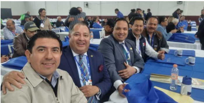
Comitiva del CR. de Puebla en los PETS Teziutlán 2024.