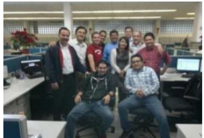
VWMX Departamento de Planeación de Equipos.