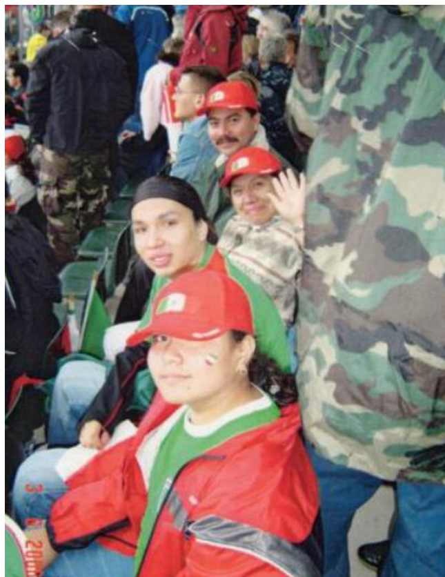
Copa Mundial de Fútbol de 2006, Alemania.