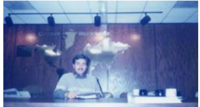
Memo en Lexington, Carolina del Sur.

Participación en la construcción de prototipos en Alemania.