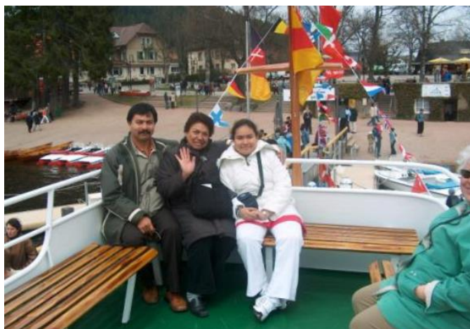
Lago Titisee Freiburg, Alemania.