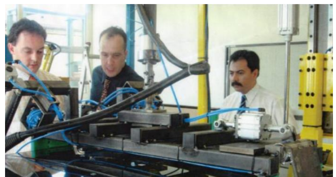
Construcción de Prototipos en Wolfsburg, Alemania.