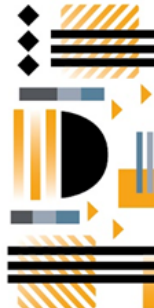
Banderín Rotary Club Cosmopolitan.